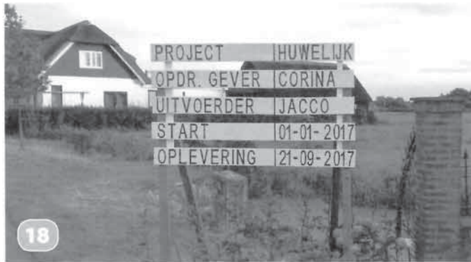
Foto 18. Nadat op 1 januari het aanbod voor het huwelijk werd gedaan, was het op 21 september zover: de oplevering! Opdrachtgever Corina Vink en uitvoerder Jacco Verburg hebben aan hun wens uitvoering gegeven door volmondig JA te zeggen. Het bruidspaar is gaan wonen in het huis van de bruidegom aan de Hoofdweg 175.