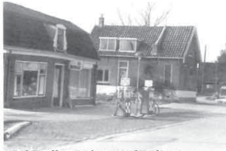
Hoek Hoofdweg/Molenweg in de vijftiger jaren.

Er is een gesprek geweest tussen de gemeente, Welzijn Woerden, het bestuur/de directie van de Bibliotheek en het Dorpsplatform over de bibliotheek. De Zegvelders ervaren een vershraling van het aanbod aan boeken en openingstijden en vrezten een 'sterfhuisconstructie'. Het bestuur/de directie heeft aangegeven absoluut in Zegveld te willen blijven, maar zoekt wel naar manieren om de bibliotheek te versterken, zodat het aantrekkelijker wordt voor bezoekers en vrijwilligers. Hierbij is de bibliotheek van Harmelen als voorbeeld aangegeven. Vanuit het