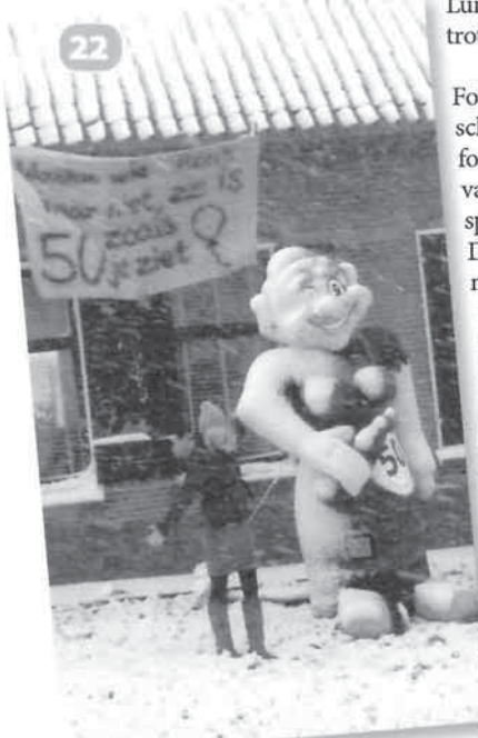
Foto 22. Het Branderpad 46 mag dan als woonplek een beetje verscholen liggen in ons mooie dorp, toch kregen wij van dit adres een foto met Sara aangereikt voor ons jaaroverzicht. Woudina Verdouw-van Rossum kon op 10 december kennis maken met Sara. Op het spandoek staat: Woudina, wie kent haar niet. Ze is 50 zoals je ziet. Door de sneeuwval die dag toch wel een beetje moeilijk te zien, maar het feest was er niet minder om.